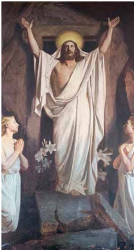
Jesu opstandelse på Dannemare kirkes altertavle

geliet. I Apostlenes Gerninger, som også er skrevet af Lukas, får vi at vide, at Jesus talte om Guds rige og spiste sammen med disciplene, der formanedes til at blive i byen og afvente modtagelsen af Helligånden (Luk 24,49; ApG 1,3-8).