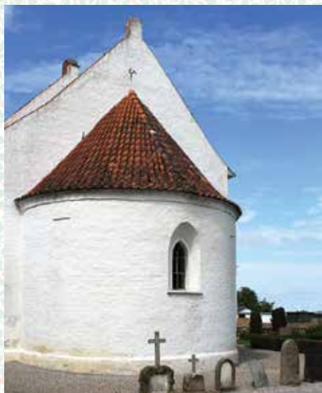
Restaurering af Arninge kirkes apsis har været en svær opgave

Gennem efterhånden en årrække har der været arbejdet ihærdigt med et par større projekter, som først nu og i den nærmeste fremtid vil blive afsluttet. Det drejer sig om det omfattende og omkostnings-tunge restaureringsarbejde af apsis i Arninge kirke, hvor kirkeværgen gennem en række år i samarbejde med forskellige offentlige instanser som f.eks. Nationalmuseet har bakset med projektet.