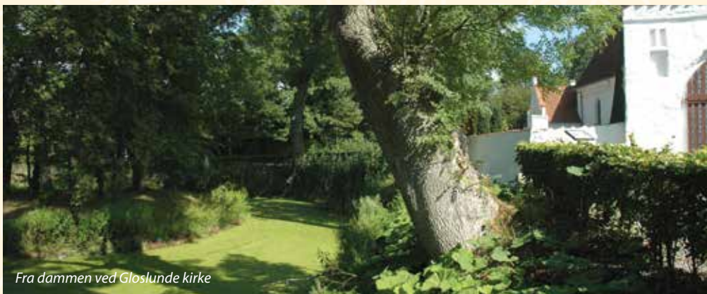
Fra dammen ved Glosunde kirke