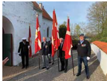
Faner fra soldaterforeningerne sidste år foran Arninge kirke

Højrebykoret medvirker til at festliggøre dagen.