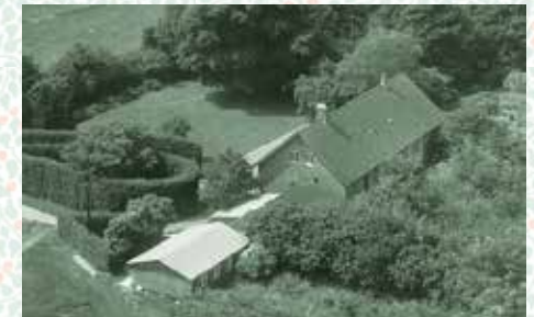
Vestenskov præstegård som den så ud i 1962. I barakken foregik konfirmandundervisningen

En vigtig - men ret så tidkrævende - sag i 2022 har været planerne om en modernisering af sognegården i Vestenskov. Ideerne til dette opstod allerede i 2021, da der var enighed om, at noget skulle der gøres ved bygningen, så den fremadrettet kunne fremstå mere indbydende, da den er menighedens eneste samlingssted, efter at præstegården i Kappel blev solgt i 2020-21. Menighedsrådet kontaktede