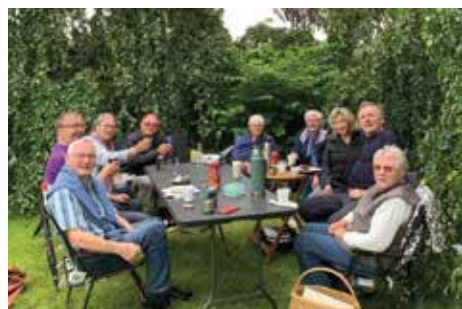
Sidste års hyggelige frokostbord i det grønne efter gudstjenesten

Bagefter samles vi for at spise den medbragte frokost. Og det er en stor glæde at se Rudbjerg Pastorat altid fyldigst repræsenteret til frokosten. Det er hygge i lange baner. Men husk madpakken, øllen og snapsen. Og et par stole.