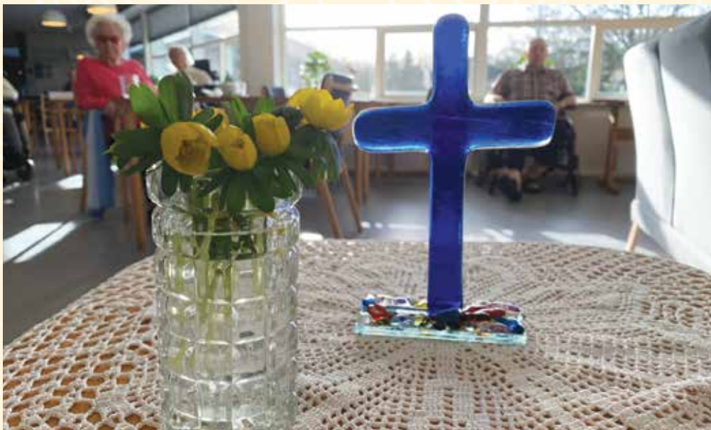
I februar var de første erantiser med på vores alter. Korset er lavet i glas af Mette Green i Græshave.

Vi synger nogle salmer, præsten fortæller, vi beder fadervor og får lyst velsignelsen. Bagefter snakker vi om løst og fast, nær og fjernt, mens vi får saftvand.