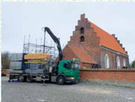
De sidste stilladser blev taget ned i januar 2023

Nu har Tillitze Kirke endelig fået et nyt tag efter lynnedslaget i 2020. Det har været et kæmpestort projekt, der har taget meget længere tid end forventet. Vi har fået et mediefirma til at lave en lille film desangående, og vi glæder os til, den bliver færdig redigeret, hvorefter den vil blive lagt op på vores hjemmeside, så alle kan se den.