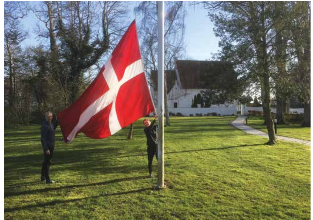
Vi flager flittigt i påsken, på halv langfredag og på hel påskesøndag

Grundtvig mente, at de fyre dage var centrale for kristendommen, fordi i den tid belærte Jesus disciplene om den