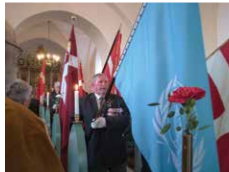
De Blå Baretter deltog med en FN-fane og viste det internationale perspektiv

Det er ærgerligt at skulle flytte det fra Arninge kirke, men Hjemmeværnsgården skråt over for kirken i den gamle førstelærerbolig er heller ikke mere ramme for det lokale flyverhjemmeværn. Og Vestenskov kirke er også større.