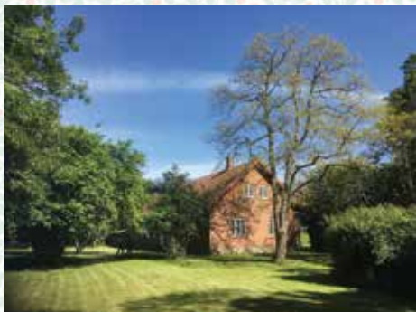
Vestenskov sognegård i dag

dog således at det nye menighedsråd skulle beslutte sig for, hvilket af forslagene der skal realiseres. Disse tre forslag er nu overladt til det nye menighedsråd, der blev valgt med udgangen af 2022.