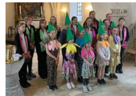
Fra Spiregudstjenesten 2022

Der er en spireplante og slikpose til alle børn. Bagefter er der kaffebord og kage i