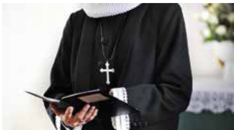
Præsten er meget bundet af ritualer og disse er tusind år gamle

af præsten har en tusindårig tradition bag sig. Når man forstår det, bliver gudstjenesten meningsfuld og nærværende. Gudstjeneste er et ekstremt symbolladet fællesskab.