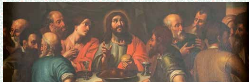
Vestenskov altertavle vil blive rensset i 2023